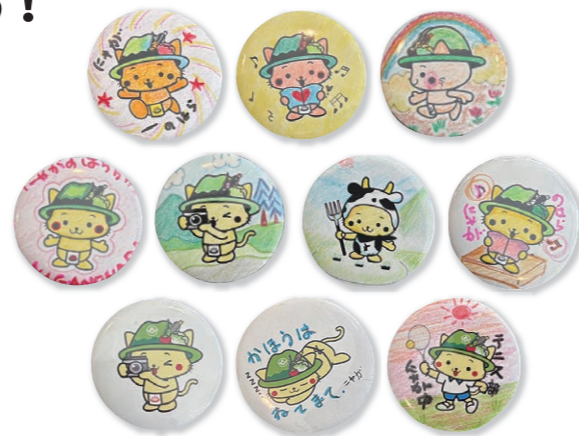
《オリジナル缶バッジ作成:1つ100円》