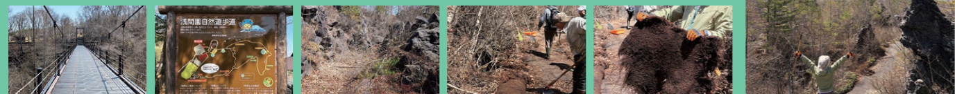
再開した吊り橋 遊歩道地図 道がなくなっている！ はびこった苔等をかきとります はかされた大きい苔！

自然遊歩道の溶岩コースに架かっていた吊り橋「鬼押し橋」が新しくなり、4月24日から開通しました。この開通で、吊り橋を渡るワクワク感を感じながら、天明3年の浅間山大噴火で流下した迫力ある溶岩を間近に見つつ、浅間山や他の山々を見渡せる溶岩コースも再開です。