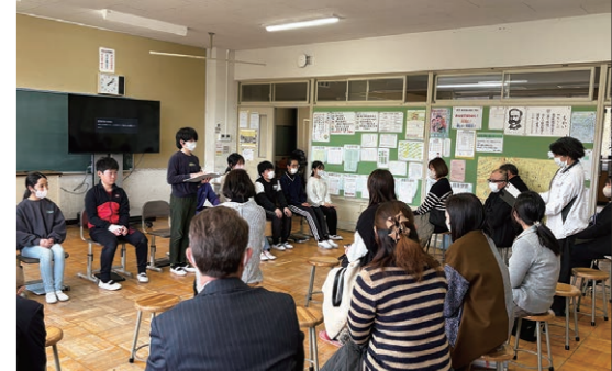
それぞれのしっかりした発表に保護者も聞き入りました。