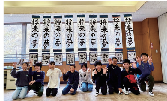
とても仲の良い6年生でした☆ 中学校でも頑張ってください!