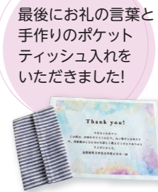
最後にお礼の言葉と手作りのポケットティッシュ入れをいただきました!

など斬新で驚く提案が次々と発表されました。具体的にどこで販売するかや、ターゲットが考えられており、「ふむふむ、これは実現できるかも」と楽しく聞かせていただきました。中でも、水中川原湯温泉街の建築費が「建設費146億5000万671円、の発表に驚き、思わず拍手をしました!」どの提案も「訪れる人に町のことを知ってほしい」という思いが詰まっていました。