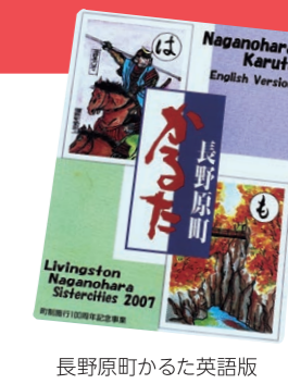
長野原町かるた英語版