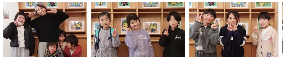
KURI-DAIRA チームすずき ダンスダンス ここはぴ チームヤスタ