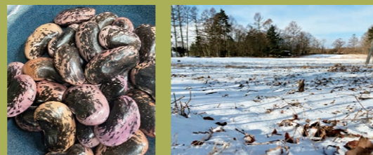
花豆 ここで花豆を栽培。まだ雪

や甘納豆、洋菓子、和菓子などレパートリーはいっぱいです。今年、長野原町に帰ってきて、仲間に教えてもらいながら趣味で育て始めて数年...という方にべったり密着取材することになりました。「毎年試行錯誤中だけど、作ったものを甘納豆にして、知り合いに配ると喜ばれるんですよ」と今回お世話になるご主人が、穏やかな笑顔で話してくださいました。町の自慢の花豆、密着していくのが今からワクワクです。