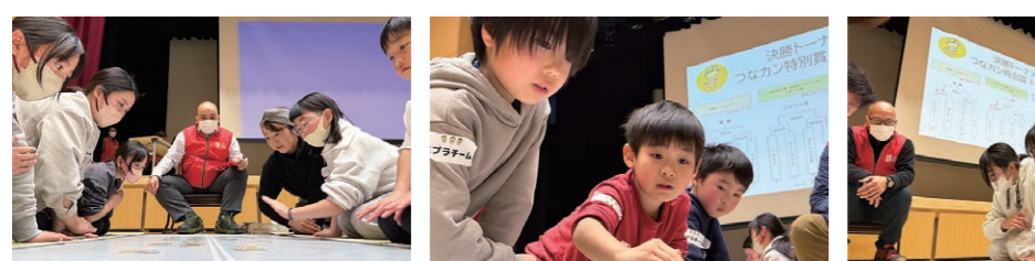
大人も本気です! 素早く手が出てスピード感あり みんな真剣な表情 接戦ありで、会場は盛り上がり!