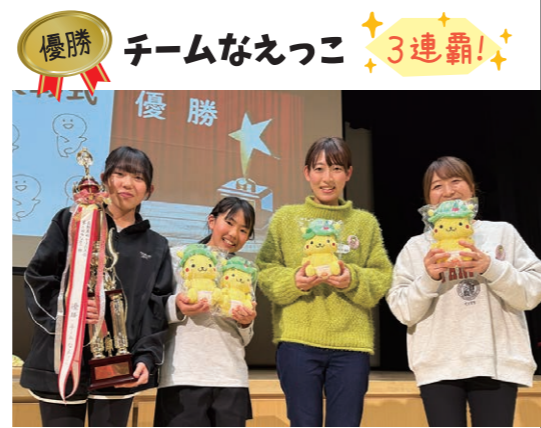
優勝 チームなえっこ 3連覇! 「チームなえっこ」3連覇おめでとう☆ 他チームも盛り上げてくれて、ありがとうございました!