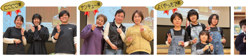
1008 A あさまるwith K 1008 C スプラチーム