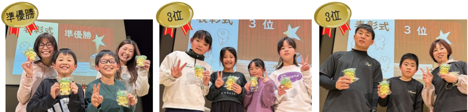
準優勝 チームはいよろこんで 3位 はちみつや 3位 1008 B

町制100周年を記念して作られた、「長野原町かるた」は町の宝です。かるたを通して町の名所を知りながら、年代を超えてみんなで楽しもう!と、今回は最多14チームに参加いただき開催しました。学校や職場の仲間、仲よし家族合同チームなど編成は様々。試合は、おとなも子どもも一緒に楽しみながら真剣勝負で、皆さんのかるたを見つめる眼差しが輝いていました。優勝は第1、2回大会に引き続き、北軽井沢から参加の「チームなえっこ」の3連覇! 準優勝「チームはいよろこんで」、3位「1008 B」と「はちみつや」でした。その他、つなカン賞特別賞として、ニコニコ賞、サンキュー賞、よくやったで賞がそれぞれ贈られました。参加の皆さんから「負けてくやしい! 来年は合宿して臨みます。」「楽しかったです。」「大人げないと思いが、思いきり戦いました。」という声をいただきました。ご参加いただいた皆さま、ありがとうございました。来年も開催予定です。たくさんの参加をお待ちしています。