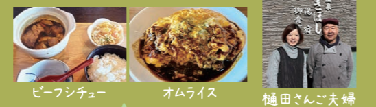
ビーフシチュー オムライス 樋田さんご夫婦

*11:00-14:00 *0297-83-2011 *営業日は月火休(定休はHPで確認を)