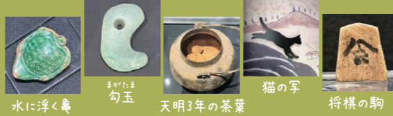
水に浮く鳥 まがたま勾玉 天明3年の茶葉 猫の写 将棋の駒