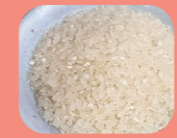
真っ白なお米に感動!

さあ!いよいよ実食です。丹精こめて作られたお米が、美味しくありません。収穫したお米を土鍋で炊きました。ピカピカ光っている炊きたてのお米に、まず良い塩をかけて一口、甘くて美味しい!キュウリのヌカ漬けてパクつく、美味しい。お米はシン