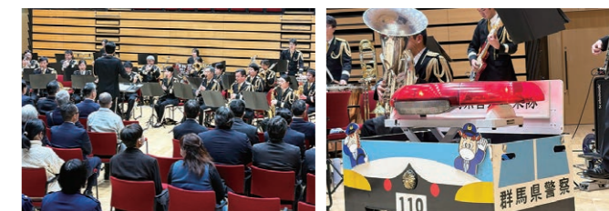
群馬県警察音楽隊による演奏にみんな聴き入りました

代田署長は山登りをしたり、3町村の温泉によく出かけるそうです。町のいい所は「人が温かいところ」で、長野原町は第二の故郷と話してくださいました。