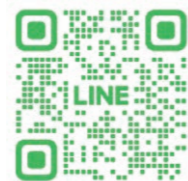
ASAMA WAVE 連絡先QRコード