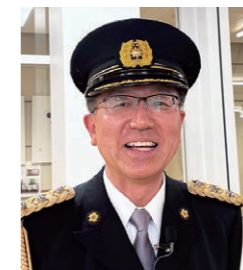
長野原警察・代田署長

1月9日、長野原警察の代田署長に許可をいただき「初点検・感謝状贈呈式」を見学しました。初点検は、警察官の服装や立ち姿や態度の他、手帳や手錠などの必要な装備品を検査し署長が確認をします。指揮官以下長野原署員23名が参加。ピンと張りつめた空気の中、号令により装備品の点検が行われました。初点検後は、昨年1年間警察業務に協力した方々への感謝状贈呈式、最後は群馬県警察音楽隊による刑事ドラマメドレー等のコンサートを聴きました。