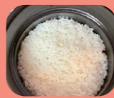
炊きたて ツヤツヤです!