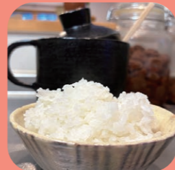
一粒一粒がしっかり立っていて 見た目とっても美味しくうまです!

プルなおかずが合います。美味しいご飯を堪能しました。お米作りという貴重な体験を通して、大変勉強になり、先人の知恵に感動し、お米の大切さを改めて実感しました。お米作りの密着は最終回です。ご協力いただいた方々に感謝します。