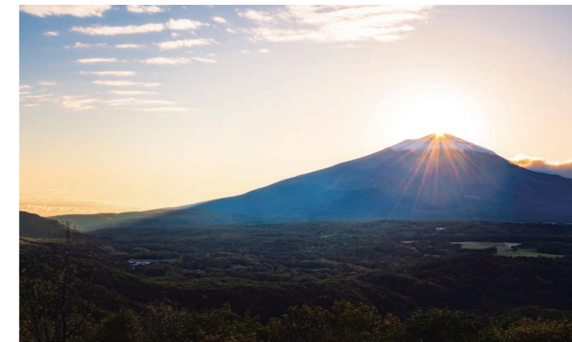
二度上峠から望む浅間山 (ダイヤモンド浅間)