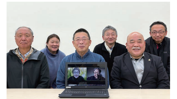
つなカン理事 12月の企画調整会議にて