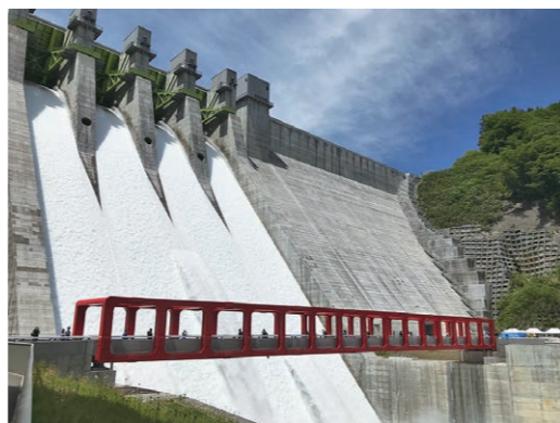
傾斜に沿って流れ落ちる水の量は圧巻です!