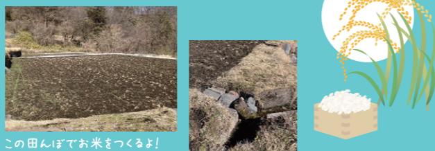
この田ほてお米をつくるよ!

昔は農協に卸していたけど、今は自分たちの分だけ育てているというこのご家族。作る苦労もあるけれど、ずっとこの生活だからそんなに大変とは思わないし、自分たちで作ったお米は最高に美味しい。愛情がこもっているのもあるけれど、冷めても美味しいんだから間違いのない。おにぎりなど冷めた時の味で美味しさの違いが判るんです。だからやっぱりやめられないわあ、と。初インタビューしたのは3月下旬。ぼちぼち5月末の田植えに向けて準備しなくちゃね、という話を伺いました。次回は田植えのお手伝い。少しでもお役にたてるようがんばります!