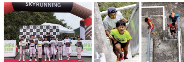
大人から子供まで町民もたくさん参加しました★

●主催/合同会社スカイランニングジャパン ●共催/長野原町 ●主管/群馬県スカイランニング協会 ※ハッ場ダムでイベント等を行いたい方はつなカンまでご相談ください。Tel.0279-82-5895