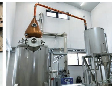
ウィスキーポットスチル