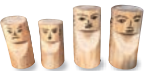
手描きの顔は表情豊か☆

次に木造双体道祖神。ヌルデの木を10センチくらいに切って、皮をむき、形を作ったところにマジックで顔を描きます。これも絵心が問われます。描いた顔をお互いに見せっこしながら笑い合うのも楽しいです。