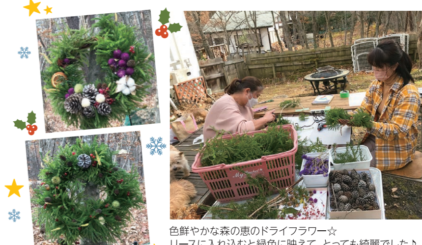
色鮮やかな森の恵のドライフラワー☆リースに入れ込むと緑色に映えて、とっても綺麗でした♪

土台になる常緑樹の葉っぱ、赤い実、松ぼっくり、どんぐりなど。その他、家で作ったドライフラワーなどを持ち寄りしました。作り始めるとみんな無言で作業に集中。作り始めて約1時間。それぞれ、世界にひとつのリースが出来上がりました。クリスマスリースを飾る意味は3つ。「魔除け(常緑樹の葉は1年中緑で冬に打ち勝つ&葉に殺菌作用がある)」、「豊作祈願(松ぼっくりやリンゴ、穂などの飾りは収穫を祈願する意味がある)」、「新年に幸運を!(リースの丸い形は境目が無いことから、終わりのない永遠の愛という意味がこめられている)」。手作りリースを作ってみませんか? 皆さま、素敵なクリスマスを!