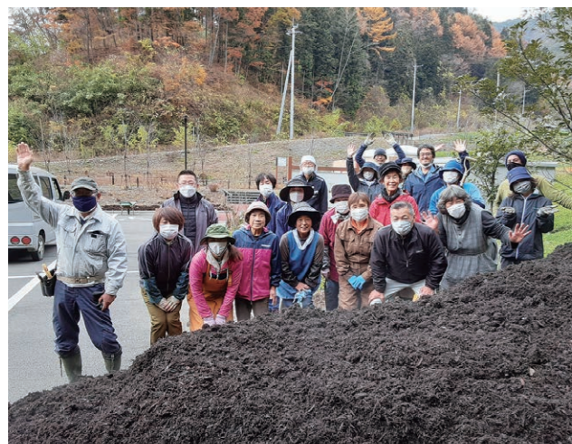
土づくりに欠かせない堆肥。牛ふん堆肥は植物にとって栄養豊富！