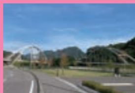
道路も鉄道もめがねです

が造られているんです。一番目立つのが湖上にそびえる3本の「ハツ場」「不動」「丸岩」大橋ですが、それ以外にも観光用を含めて数えきれないくらいの橋が建造されているんです。夏場だけ現れる「湖の駅 丸岩」下の【下田橋】や湯水でない【見る事の出来ない「不動大橋」直下に水没している【上湯原橋】など工事用の橋として建造された橋。また、吾妻渓谷内に再建された【猿橋】を筆頭とする観光用の歩行者専用の橋。それ以外にも広範囲にわたって建造されています。工学・理工学を専攻している人には堪らないでしょうが、専門的な事は忘れ紅葉(自然)と橋(構造物)の綺麗な秋の風景を切り取りに出かけましょう。(樋田省三)