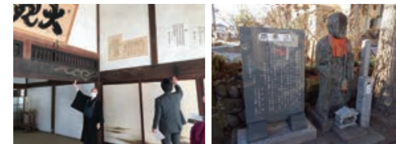
泥流に流されずに残った2本の柱