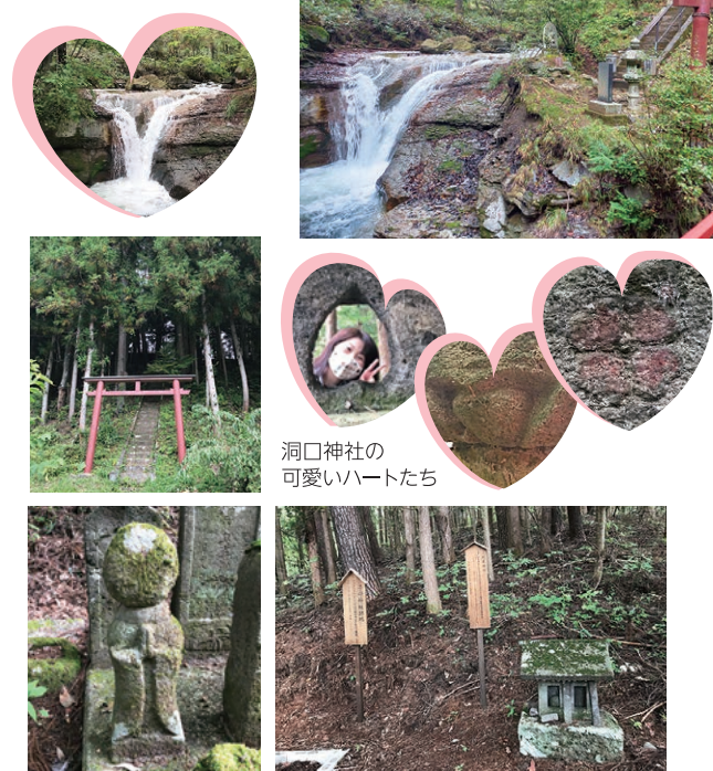
心癒される可愛らしい姿で見守ってくれているお地蔵さん

「#ハートプロジェクトながのほら」で投稿いただいた情報から、私たちが実際に行ってみた「行ってんべえ」をご紹介。まずは大津にある「荒澤不動明王」。草津方面に車を走らせると道路沿いの流れる川に赤い鳥居や建物が見えるので、ずっと気になってたんです。そこに「ハート」がある、という情報が!これは行くしかない!この滝「出会の滝」と呼ばれているそうです。なんと滝がハート型に見える。この日は水量が少なかったのが「ハート」というより「V」?地元の方によると、水量によってもっとハートに見えたり、水量が多すぎてハートじゃなくなったりするそうです。その時の運次第...というも、占い気分が面白いかも。 次に同じく大津にある「洞口神社」へ。神社に着くと早速ハート発見。逆さハートの灯籠の窓、灯籠の柄にもハート、赤いハートも発見!ここのハートは丸みのある可愛い優しいハートです。神社の周りを散策したらいつぱいの可愛いお地蔵さんが出迎えてくれました。さらに進むと何やら建物の跡が。「子守神社」の跡地で、昨年末に洞口諏訪神社本殿内に遷座された、と説明書きがありました。この洞口神社、子守神社も加わってさらにハートフルがパワーアップした神社なんです。皆さんの「ハートフルな行ってんべえ」#投稿お待ちしております。