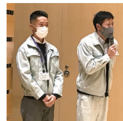
グンマ×メンバーのYoutubeの方々が取材に来ました。