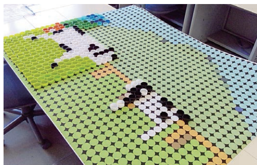
決められたマスに同じ色のペットボトルキャップを貼り付けて完成させます。パズルみたいでとっても楽しい!

長野原高校(つなカン会員)の商業実践授業を選択している生徒さんによる、イベントの紹介です。このイベントの目的は、ペットボトルキャップを使ったアート作品を作りながら、環境配慮、SDGsをみんなで学ぶことです。内容は模造紙にペットボトルキャップを張り付けて、アート2作品(浅間山と乳牛、群馬県地図の中の長野原町)を作成します。長野原高校生と一般の方々のコラボ企画です。ご都合のつく方は、是非ご参加ください。ペットボトルキャップ無しでも大丈夫です。