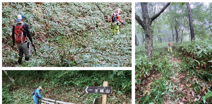
山の静けさの中、唸りをあげる刈払い機。生い茂った熊笹と格闘中。