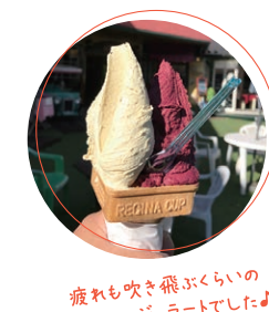
疲れも吹き飛ばすくらい美味しいジェラートでした!